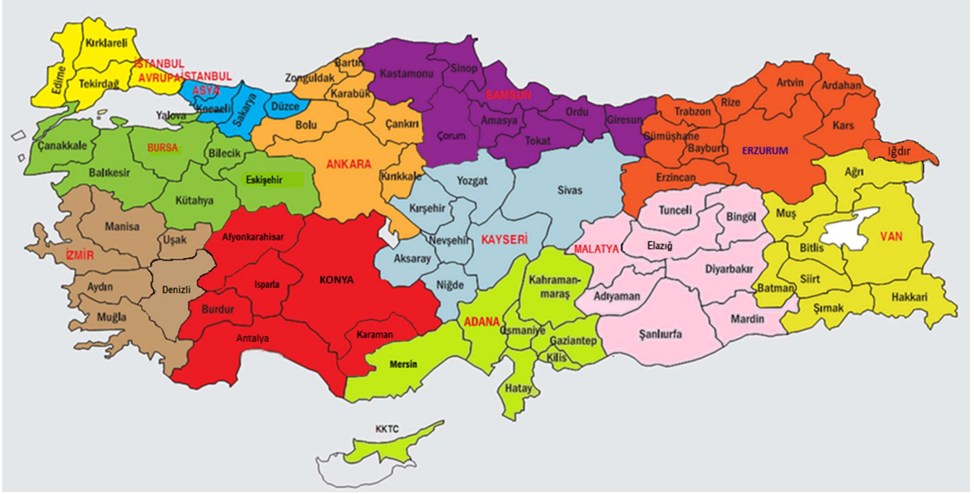
Şekil 1. Yarışma Bölgeleri Haritası

Bu yarışma Türkiye genelinde 12 bölgede yapılmaktadır. Her bölge için bir il, merkez olarak seçilmiştir. Her bölgeye il merkezinden iki öğretim üyesi, TÜBİTAK tarafından yarışmalardan sorumlu Bölge Koordinatörü ve Bölge Koordinatör Yardımcısı görevlendirilir. Adana, Ankara, Bursa, Erzurum, Konya, İstanbul Asya, İstanbul Avrupa, İzmir, Kayseri, Malatya, Samsun ve Van bölge merkezi illerdir. İllerin bölgelere dağılımları Şekil 1’de verilmiştir.